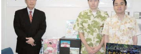
東京住宅ローンセンター