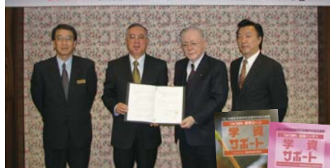
専修学校各種学校協会提携調印式