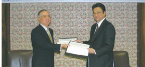
協業契約を締結した大城頭取(左)とインフォマートの村上社長