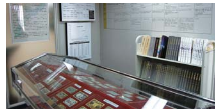
「りゅうぎん金融資料館」館内