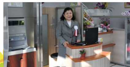
店内の総合受付窓口