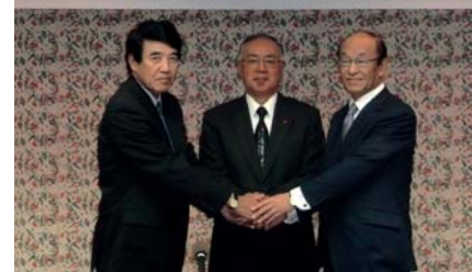
医療関連業務提携記者会見