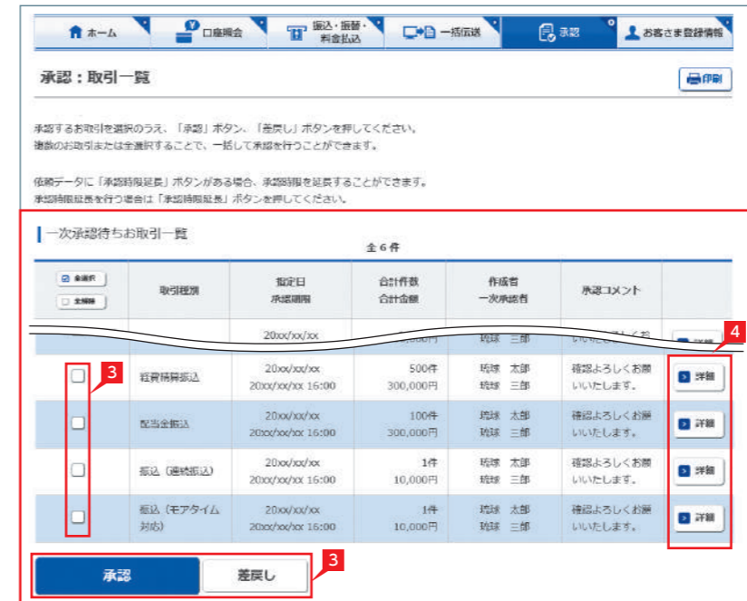
「承認:取引一覧」画面の案内

承認時限は振込(振替)指定日前営業日の16時です。 ※前営業日決済給与振込のみ、承認時限は振込指定日の3営業日前18時です。