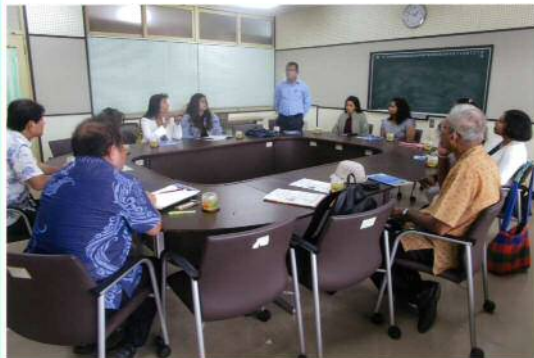
2019年11月7日 | 中部商業高等学校の見学と校長先生との面談