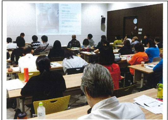
【講義】サポーターのこころのケア-GMAT 医療の現場から