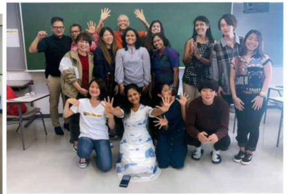
2019年11月8日 | 沖縄大学の学生との交流会