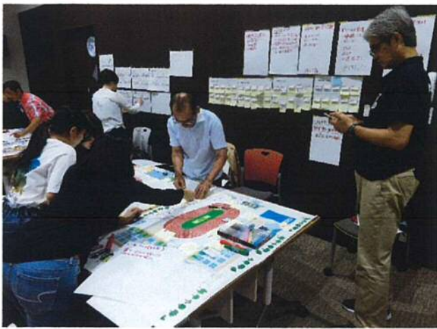
避難所運営ゲーム（HUG）訓練の様子①