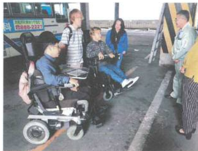
那覇バスターミナルで運転手向けの研修に参加した様子