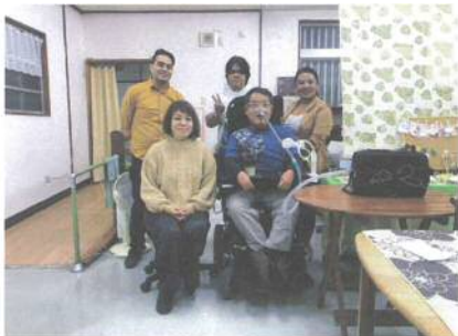
那覇自立生活センターで精神障害者地域生活の支援について研修

本事業を通し、ネパールからの研修生にとっては福祉先進国と呼ばれる日本からの技術支援を伴いながら、重度障害者の地域生活支援の取組み手法のモデルケースとして示すことができ、今後沖縄の自立支援・障害者運動を担う若手当事者にとっては、ネパールの当事者からエンパワメント、多文化の共生と理解を深め合うこと、制度を作る過程などが見えることで知識だけに頼らない経験を得ることができました。