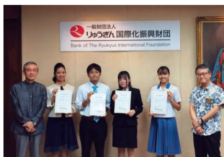
留学派遣者奨学金贈呈式

2020年度は、高校生1名、大学院生3名の計4名の留学派遣予定者が決定しました。