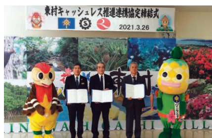
キャッシュレス推進連携協定調印式