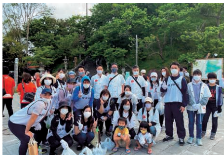
名護支店 (桜プロジェクト)

それぞれの地域において、地域の皆様と協力し合い、地域の環境美化に取り組んでいます。