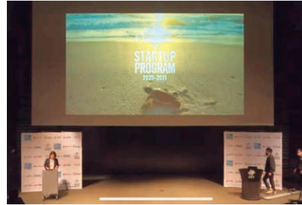
「OKINAWA STARTUP PROGRAM」 成果発表会

県内企業7社や県内外の起業家支援機関と連携し、沖縄から革新的で競争力のあるベンチャー企業（スタートアップ）の創出・育成を行う「OKINAWA STARTUP PROGRAM」を2016年度から継続的に実施しています。本プログラムの参加企業（チーム）には、当行および県内外の起業家支援機関がビジネスプラン熟成のメンタリング等を行い、事業化が見込まれる優れたプランに関しては、BORベンチャーファンドからの出資やパートナー企業とのマッチング等のサポートを実施しています。