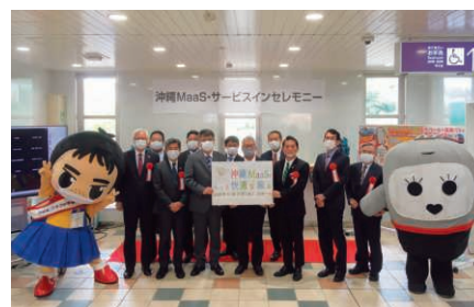
第1フェーズ サービスインセレモニー

なお、この沖縄MaaSは、国土交通省の令和2年度日本版MaaS推進・支援事業に選定されました。