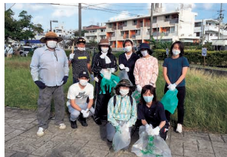
国場支店・古波蔵支店 (地域 清掃活動)