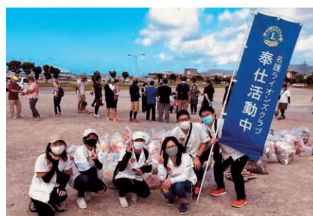
名護支店 (名護漁港 清掃活動)