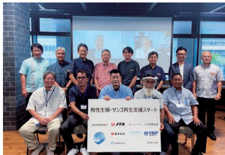
有性生殖・サンゴ再生支援協議会

同協議会では、国内で初めて「実用レベルで海域での有性生殖サンゴ増殖」を実施する八重山漁業協同組合を支援します。